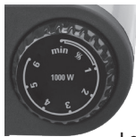
Left control knob Model DB1001B