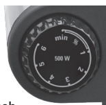
Right control knob Model DB1002B